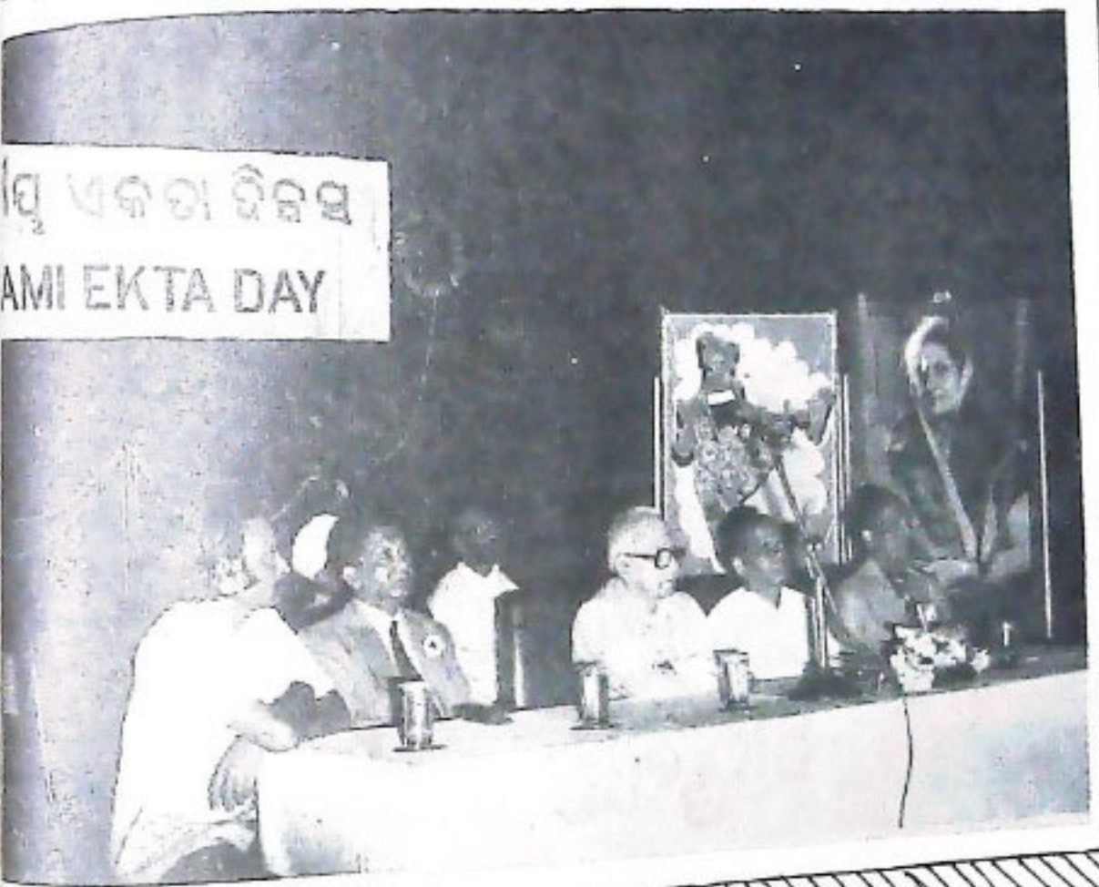
ସ୍ଵାଧୀନତା ଦିନସ୍ମୃତି AMI EKTA DAY

ଏକତା ଓ ସଂହତିର ମଧୁମୟ ସ୍ଵର । ଜାତି, ଧର୍ମ ଓ ବର୍ଣ୍ଣ ନିର୍ବିଶେଷରେ ସେଇ ଏକତାର ମଧୁମୟ ଭାବାବେଶ ଆମକୁ ଅନୁପ୍ରାଣିତ କରୁ ।