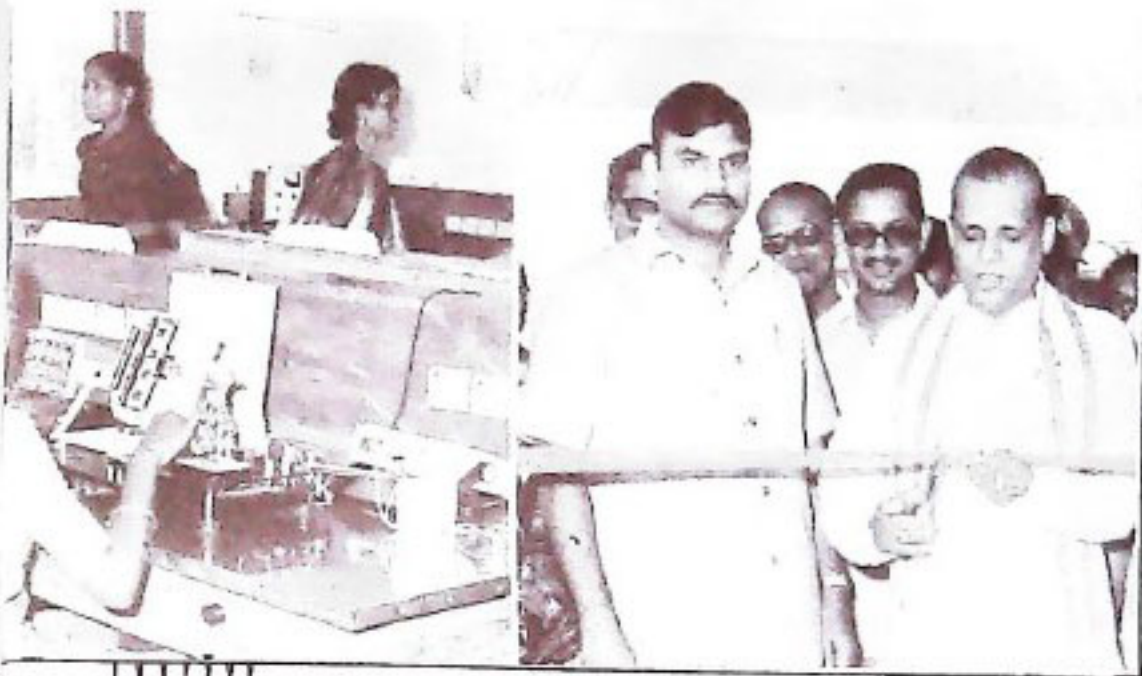
ଯେକା ବିନ୍ଦୁପୂର୍ଣ୍ଣରେ ପ୍ରତ୍ୟାମନ୍ତ୍ରୀ ଶ୍ରୀ ପଟ୍ଟନାୟକ ଉଲ୍ଲେଖଯୋଗିକ କଲ ଯଦି କାରୁଣ୍ୟା ଉଦ୍‌ଘାଟନ କରୁଛନ୍ତି C.M SHRI PATTANAIK INAUGURATING 63 LAKH ELECTRONIC WATCH FACTORY AT CHANDAKA..