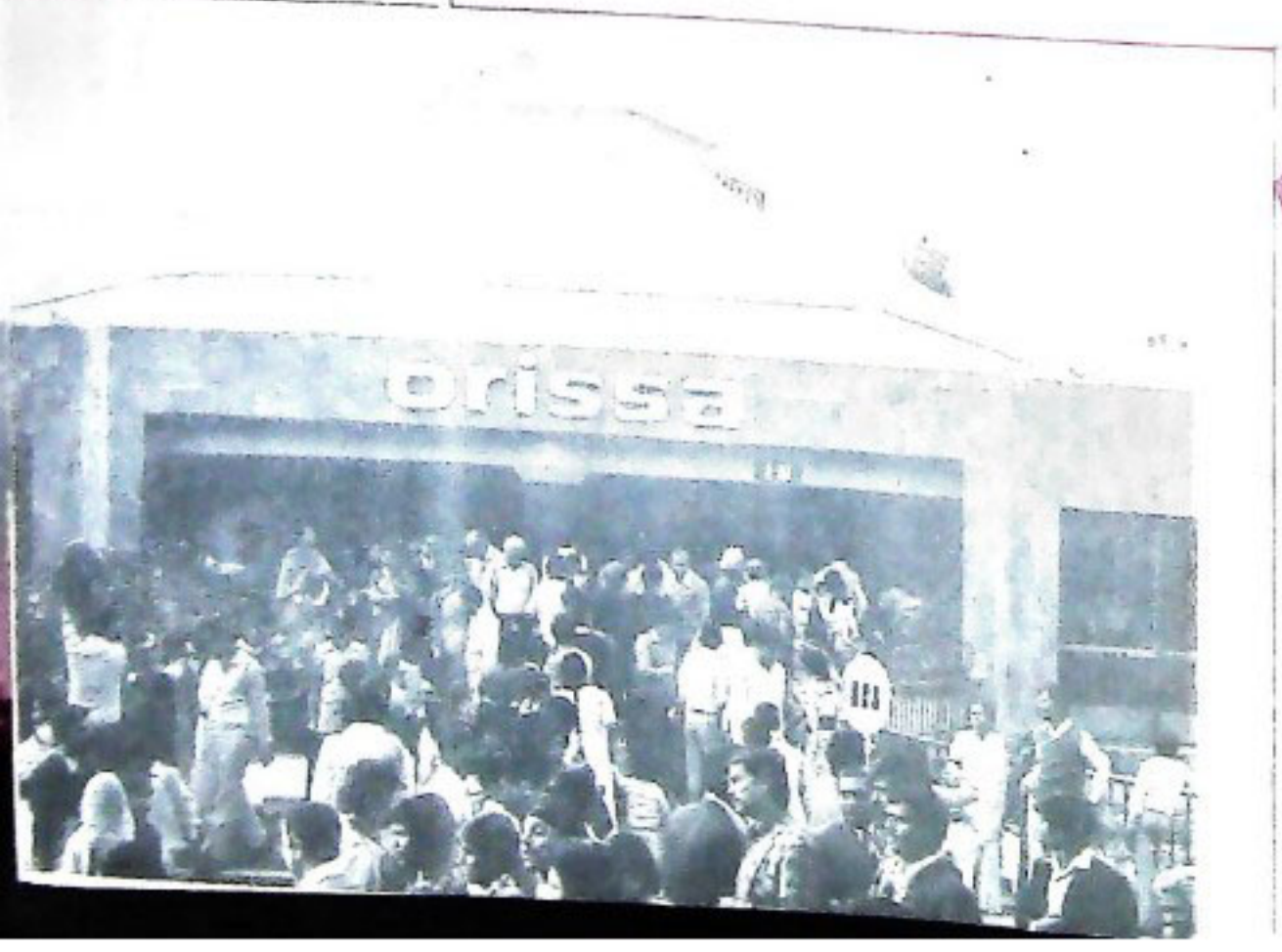
↑ ORISSA PAVILION AT INTERNATIONAL TRADE FAIR, NEW DELHI, 1983 ନୂଆଦିଲ୍ଲୀରୁ ଆସୁଥିବା ବାଣିଜ୍ୟ ଯେଣୁ ଓଡ଼ିଶା ମୁକ୍ତବାଦୀ (ମୁକ୍ତବାଦୀ)