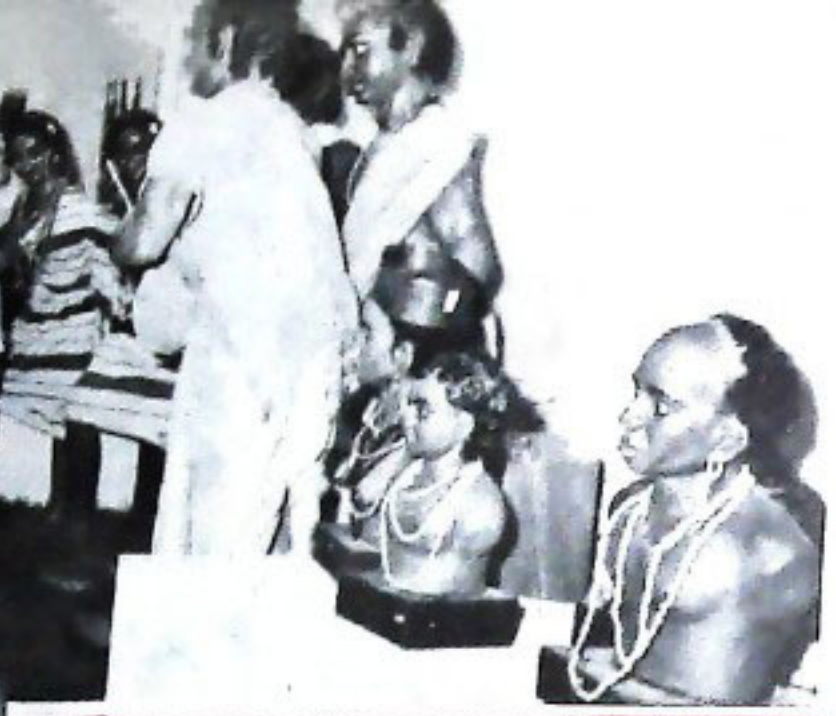
↑ DISTINGUISHED FREEDOM FIGHTER MRS, ARUNA ASAF ALI VISITS ORISSA PAVILION... ଓଡ଼ିଶା ମୁକ୍ତବାଦୀ ଯେଣୁ ବିଜୟ ପାଇଁ ଯିବାର ସମୟ ଆସିବାରୁ