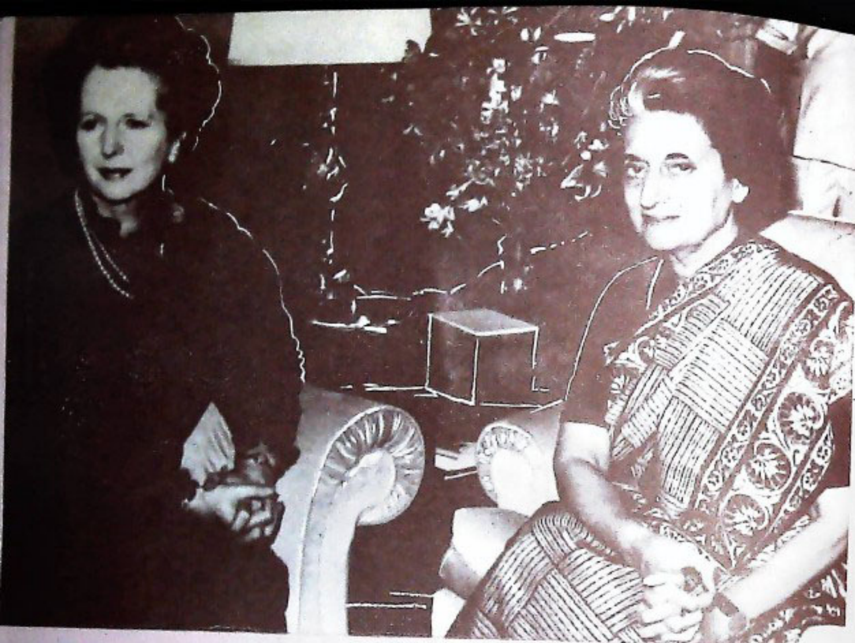
ଥେଚର୍ - ଇନ୍ଦିରା ସାକ୍ଷାତ ... MRS THATCHER MEETS MRS GANDHI