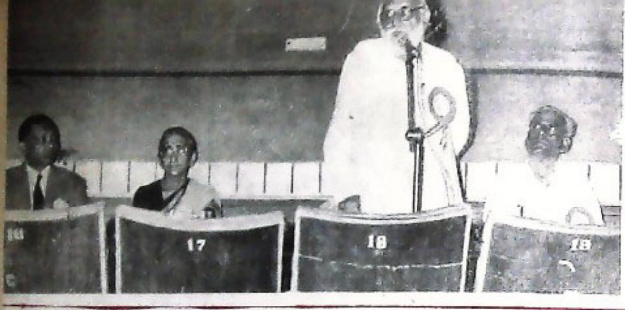
ସ୍ୱାଗତ୍ ଏକ ଭାବନୀତ ଭିକ୍ଷକରେ ଭାଷ୍ୟ ଦାନ ଶ୍ରୀ ବିଶ୍ୱସ୍ତର ନୟ ଯାଉଛି... GOVERNOR SHRI PANDE INAUGURATING A FILM AT SWATI