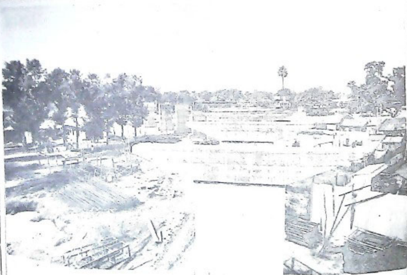
ମର୍ଯ୍ୟାଦାରୁ ଗୋଷ ସର୍ବମାନୁଷ୍ଠେ କେତକ ପୁରୁଷ ଶ୍ରେଣୀକୁ ।

ଶ୍ରୀ ଅରବିନ୍ଦ ଆଶ୍ରମ ଶ୍ରୀ ଅରବିନ୍ଦ ମାର୍ଗ, ନୂଆଦିଲ୍ଲୀ-୧୧୦୦୧୭