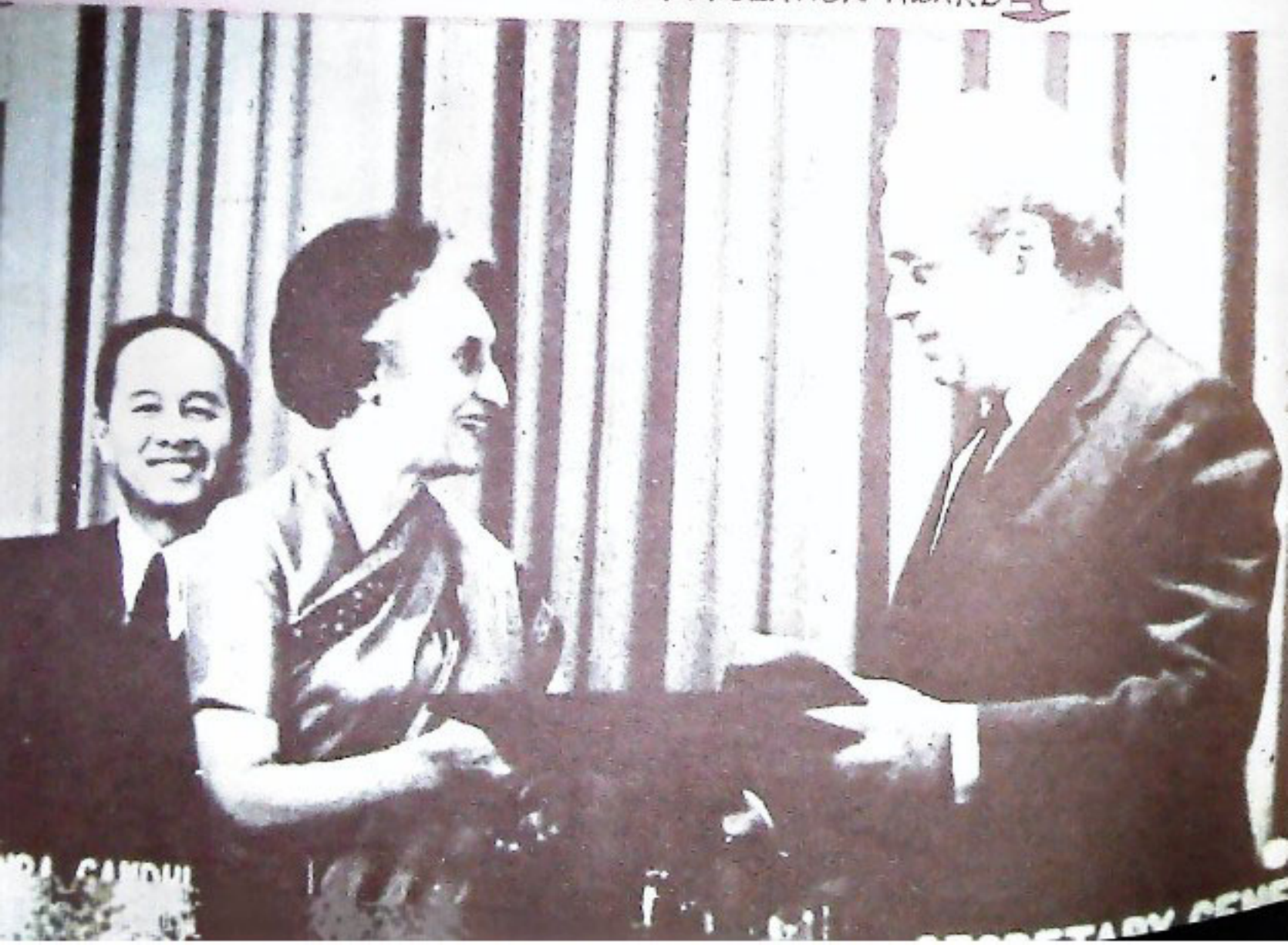
ଜାତିସଂଘର ଜନନିୟନ୍ତ୍ରଣ ପୁରସ୍କାର SMT GANDHI RECEIVING UN POPULATION AWARD